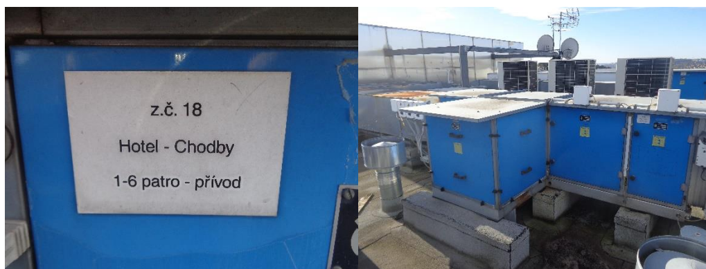
Foto 1 - Současný stav jednotka č. 18

Vzhledem k omezenému manipulačnímu prostoru a omezeného přístupu na úroveň příslušnou střechy je nutné „počítat“ s podílem „ruční“ manipulace.