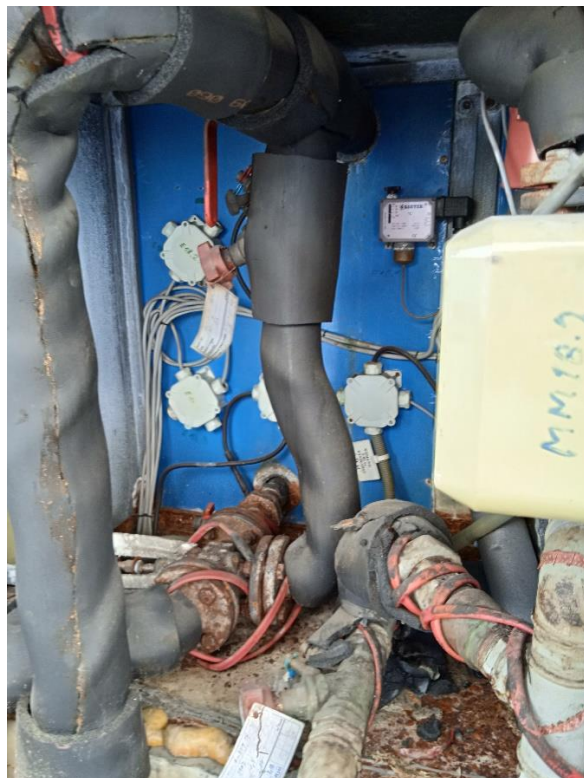
Foto – Současný stav jednotka č. 19